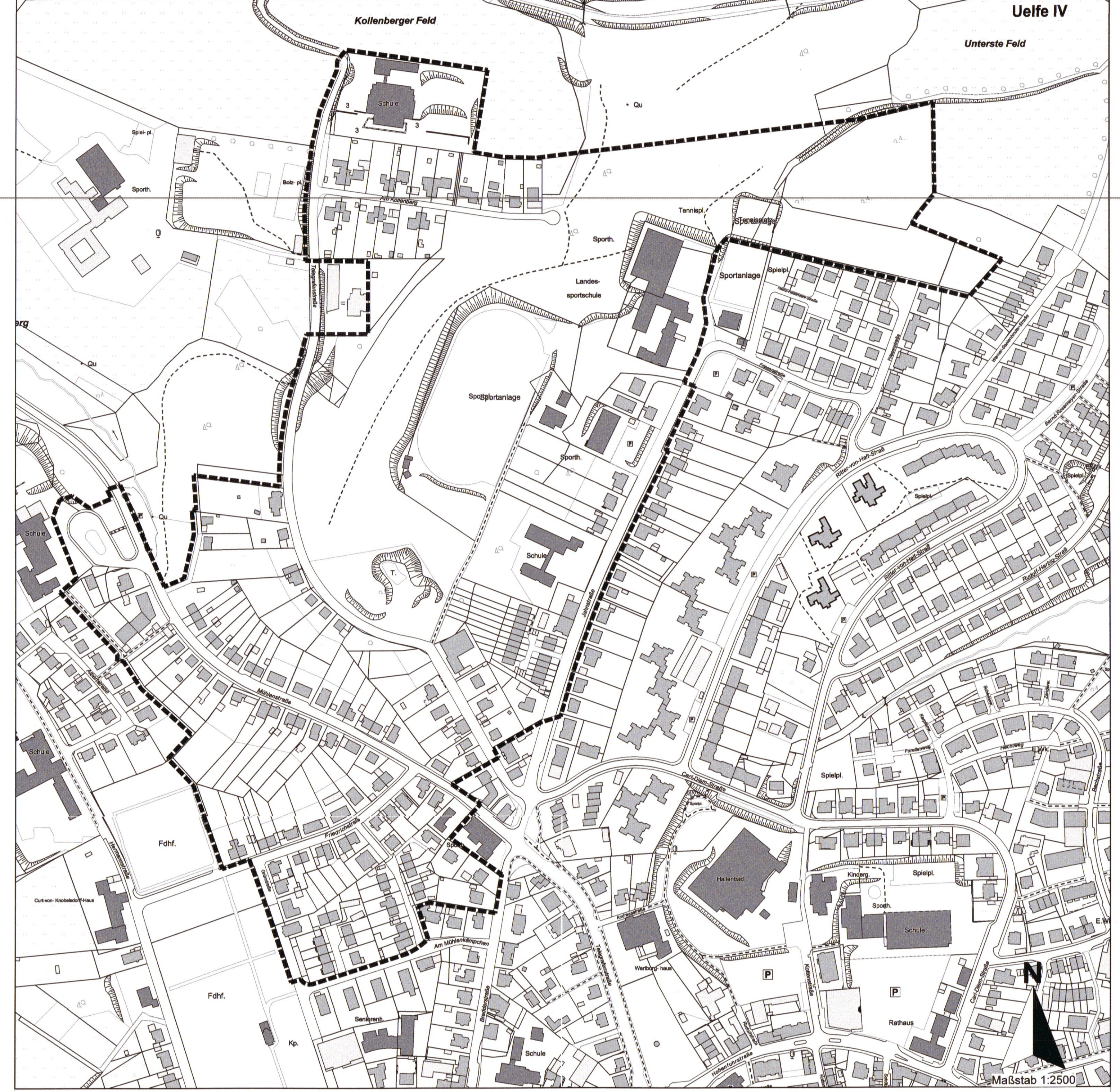
Geltungsbereich des Bebauungsplans Nr. 50, 3. Änderung